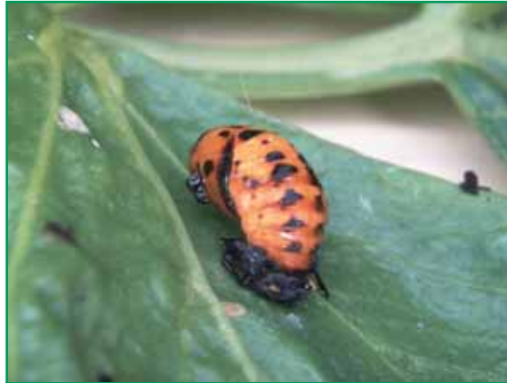
Autor: E. Rodríguez Bernal

Una pupa de mariquita de la que saldrá un adulto. Es muy frecuente encontrarlas sobre las hojas o tallos del cultivo.