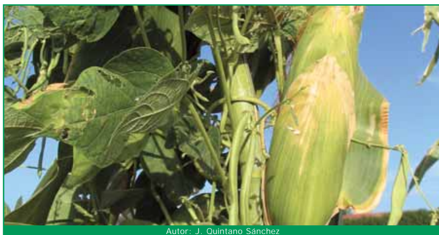
Autor: J. Quintano Sánchez

Famosa asociación maíz-judía, donde el maíz sirve de soporte a la judía y esta le ofrece nitrógeno de forma natural.