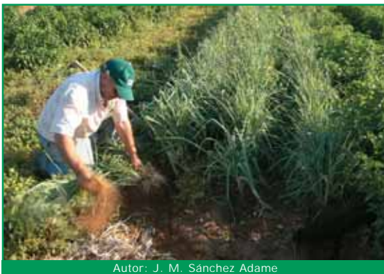
Autor: J. M. Sánchez Adame

Cultivos intercalados. La especial disposición de los cultivos dificulta la acción de las plagas y facilita la de los insectos auxiliares.