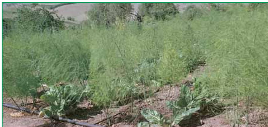
Autor: E. Rodríguez Bernal

Las asociaciones de cultivo también son una forma de aprovechar el espacio. Mientras el espárrago se desarrolla, en las calles se obtiene acelga.