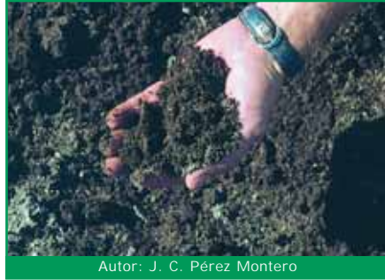
Autor: J. C. Pérez Montero

Las variedades locales de cultivo, no sólo están adaptadas a cada zona y sus particularidades, siendo más resistentes a plagas y enfermedades, sino que suponen un patrimonio genético irremplazable, cada vez más valorado sobre todo en el comercio local.