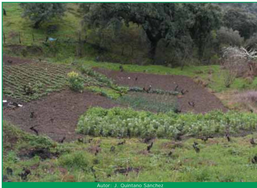
Autor: J. Quintano Sánchez

Hoy por hoy parece posible “sustituir” los insumos convencionales, por otros autorizados en agricultura ecológica. Pero es importante saber que la Agricultura Ecológica no es una “agricultura de sustitución”, sino un conjunto de acciones entre las que se encuentran la restauración y conservación de la diversidad del medio agrícola, el mantenimiento y aumento de la fertilidad