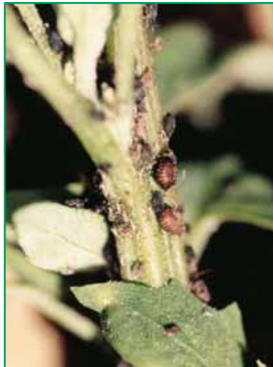
Autor: J. M. Sánchez Adame

Una pupa de mariquita de la que saldrá un adulto. Es muy frecuente encontrarlas sobre las hojas o tallos del cultivo.