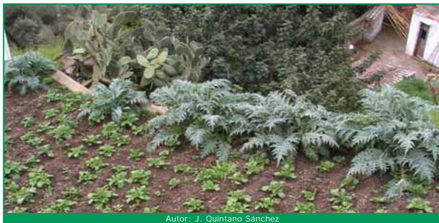
Autor: J. Quintano Sánchez

Los métodos de control directo deben ser el último recurso ya que los insecticidas, aun estando permitidos, no diferencian entre insectos perjudiciales y fauna beneficiosa. La necesidad de su utilización de forma repetida y generalizada responde a errores cometidos en las estrategias de manejo (tabla 8) que tienen por objetivo prevenir la aparición de “plaga”. Lo mejor es realizar tratamientos de forma puntual, en las zonas donde haya foco de plaga para no afectar a toda la finca.