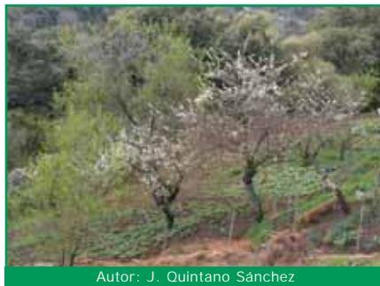
Autor: J. Quintano Sánchez

Las variedades locales, muchas de ellas ya desaparecidas, son fuente recursos utilizables para la resistencia a plagas y clima. Pese a la baja productividad de algunas, cada vez son más valoradas, siendo necesaria su conservación.